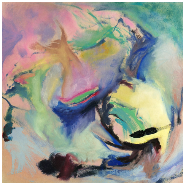
I am That I Am , 2014 Öl auf Leinwand, 75 x 75 cm