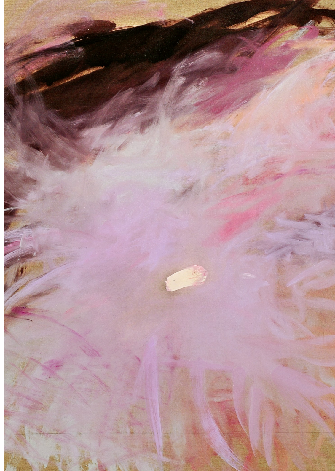
Root , 2015 Druck auf Somersetpapier, 26x26 cm